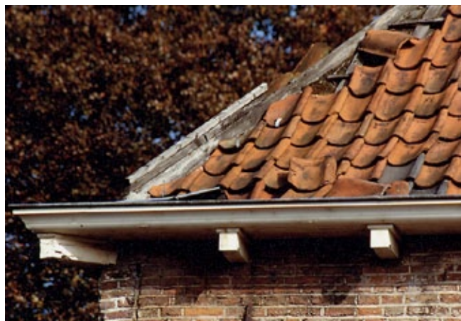
Voor het vervangen van slechte dakpannen door pannen van dezelfde soort en kleur is geen vergunning nodig.