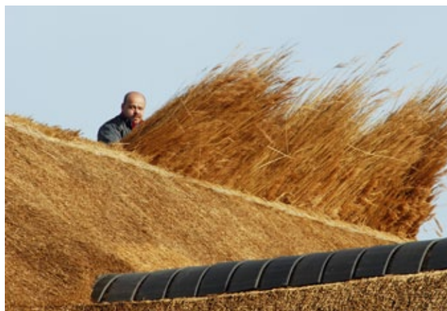
Voor het opstoppen van een rietdekking is geen vergunning nodig. Maar wanneer al het riet wordt vervangen is wel een vergunning nodig.