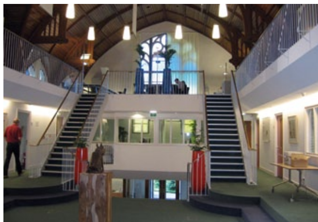
Voor het verwijderen of vervangen van een recente, niet-monumentale trap is geen vergunning nodig.

Een bouwhistorisch onderzoek kan veel inzicht bieden in de geschiedenis van uw pand. En het kan u helpen een goed plan te maken. In ons land is een aantal bouwhistorische bureaus actief. Zie ook www.bouwhistorie.nl